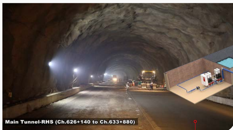
Foto del tunnel Samruddhi durante la fase di costruzione