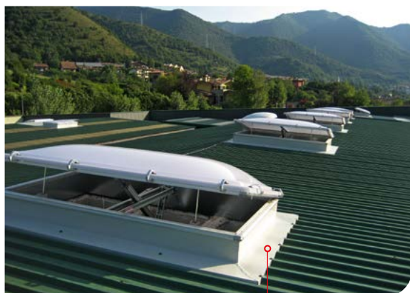
SMOKE OUT® doppia funzione