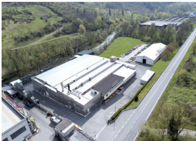
Veduta aerea dell'azienda

Caratterizzato da una working life di ben 30 anni (se impiegato, posato e sempre mantenuto nelle condizioni ideali indicate dall'azienda), questo nuovo collare si pone come perfetto completamento della gamma di soluzioni di Marvon per la protezione passiva al fuoco, che include: il collare tagliafuoco Daisy (di cui abbiamo già parlato in precedenza), maniglie per porte tagliafuoco, le guarnizioni termo espandenti Tecnoflame e la linea di schiume e sigillanti Tecno F-240 e Tecno S-240 (anche questi una novità 2017).