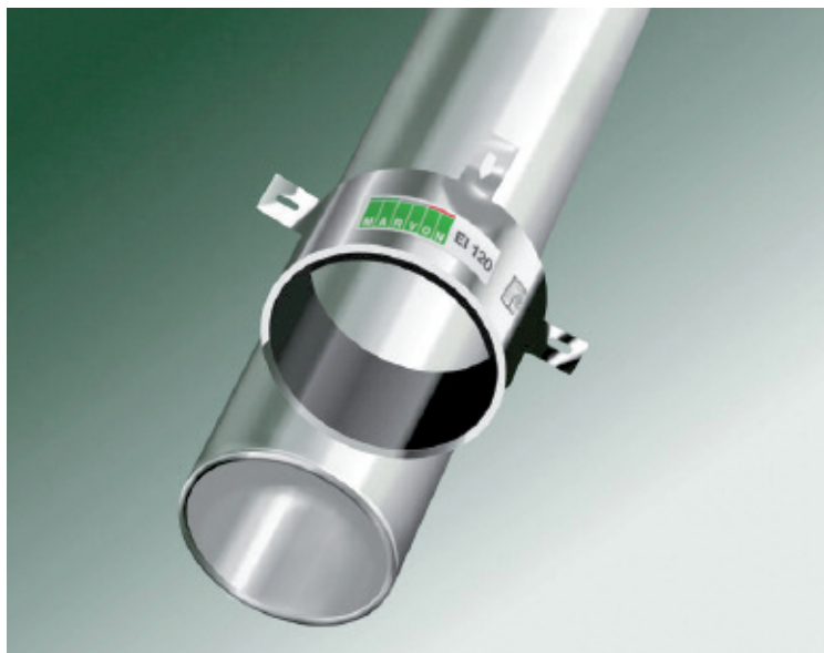
Il Collare EI120

mento termico di 120 minuti. Costituito da un corpo centrale in metallo e viti di fissaggio che ne garantiscono la facilità di installazione, questo nuovo prodotto è perfetto per ogni necessità di impiego: utilizzabile per tubazioni nuove o già esistenti, è in-